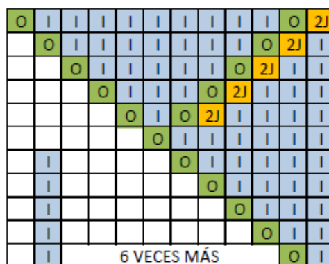
Estrella capota bebé